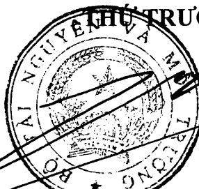
Trần Hồng Hà