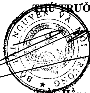
Trần Hồng Hà

KT. BỘ TRƯỞNG BỘ TÀI NGUYÊN VÀ MÔI TRƯỜNG THỦ TRƯỞNG