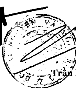
Trần Hồng Hà

KT. BỘ TRƯỞNG BỘ TÀI NGUYÊN VÀ MÔI TRƯỜNG THỨ TRƯỞNG